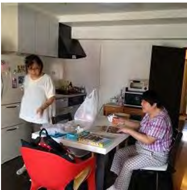
ヘルパーさんと夕食のそうだん