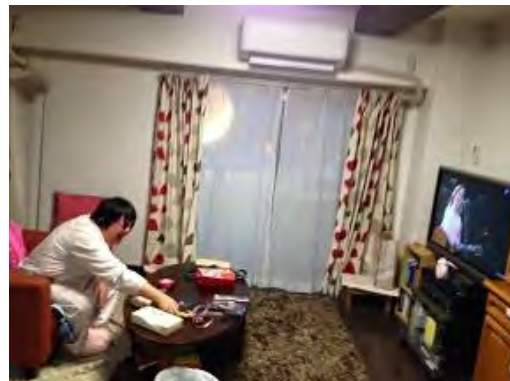
大好きな中島みゆきのDVD