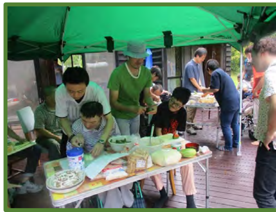
みんなでクッキング！