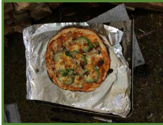
本格的なピザのできあがり！