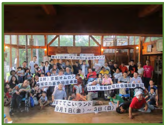
みんなで集合写真

参加者については顔馴染みの方が多いので、来年は新たな障害者の方も多く参加できるように頑張っていきたいと思います。