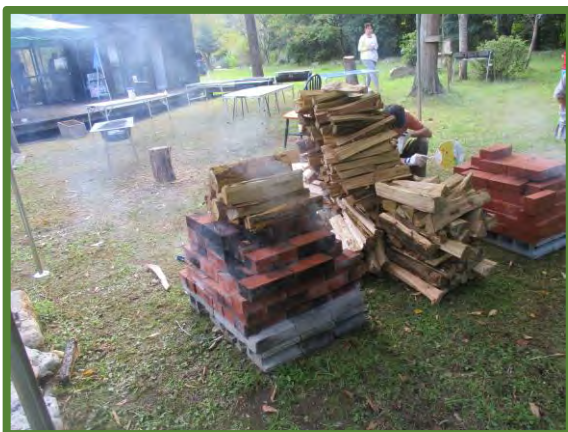
キャンプ名物のピザ釜